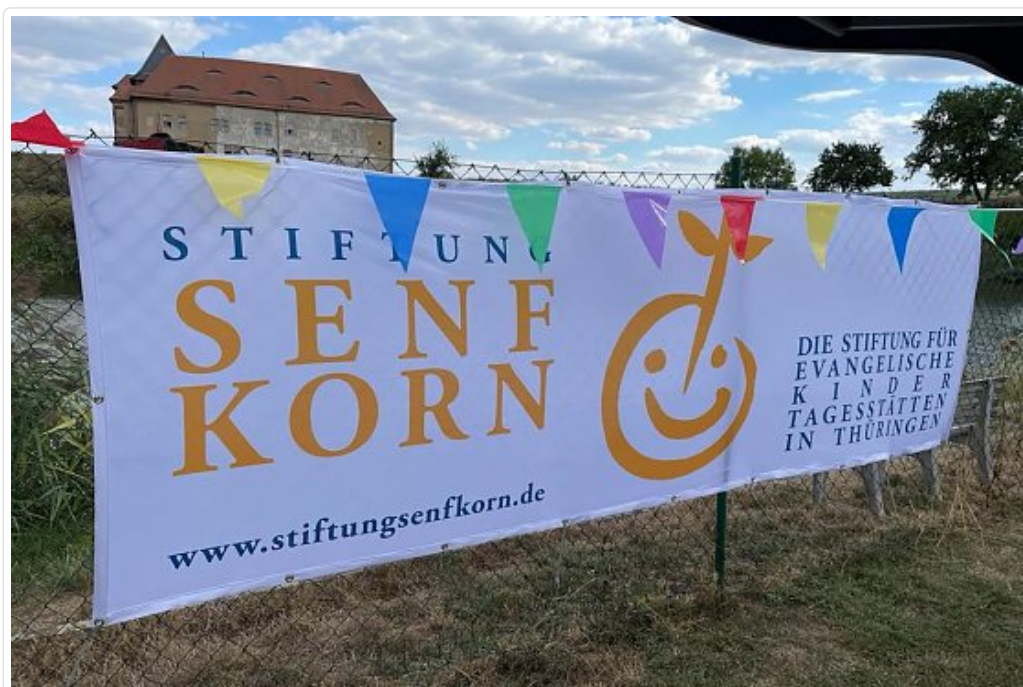
Spendenaktion für Schallisolierung in der Kita