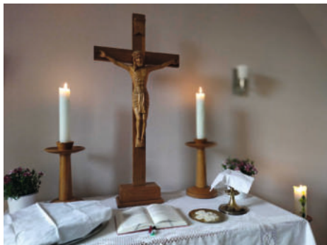
Passionszeit in Ichstedt