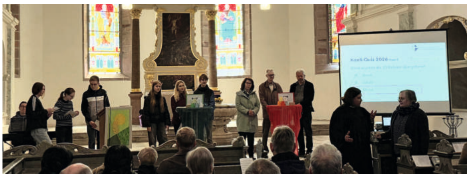
Vorstellungsgottesdienst vor der Konfirmation, Bad Frankenhausen