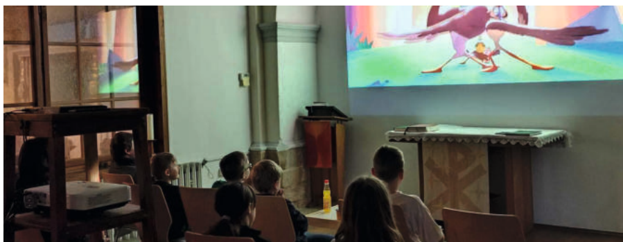
KinderkirchenKINO in Bad Frankenhausen