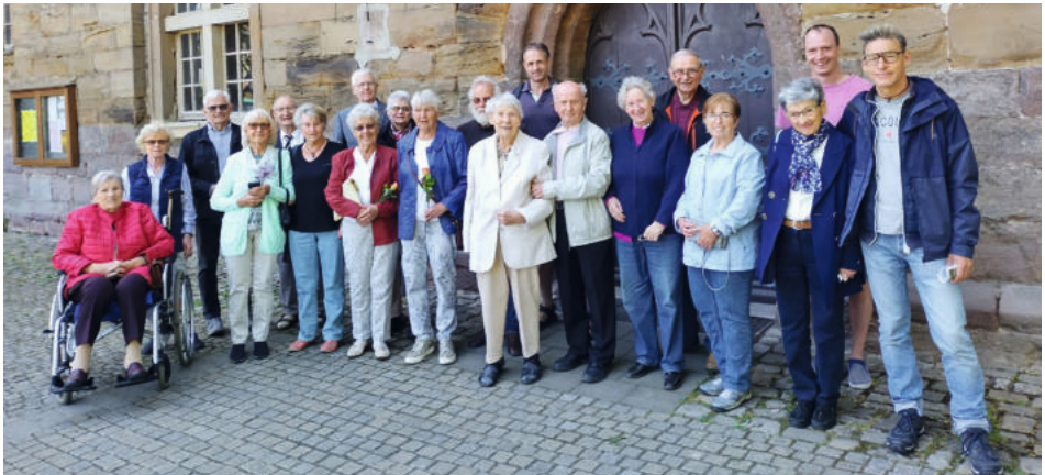
Konfirmationserinnerung 2023 in Bad Frankenhausen