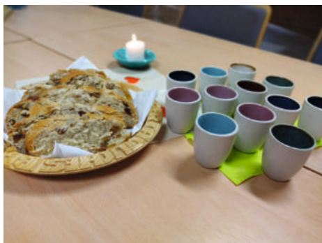
Kinderkirche mit Agapemaal, Bad Frankenh.