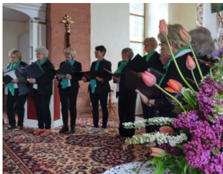
Sonntag Kantate in Ichstedt