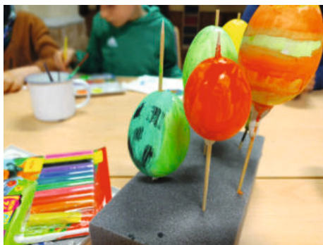
Ostervorbereitungen Kinderkirche, Bad Frkh.