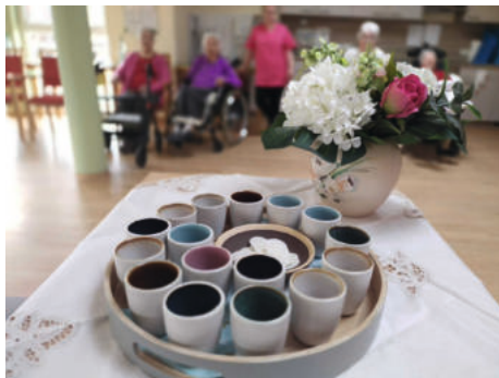
Abendmahl im Haus Martha, Oldisleben