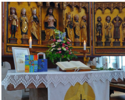
Konfirmation in Ringleben